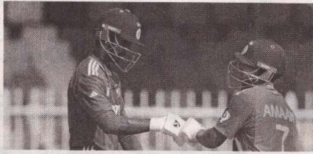
வெற்றி பெற்று இறுதிப் போட்டிக்கு முன்னேறியது. (எ)

இந்தத் தொடரின் அரையிறுதி ஆட்டங்கள் நேற்று நடைபெற்றன. இதில் ஓர் அரையிறுதி ஆட்டத்தில் இலங்கை - இந்திய அணிகள் மோதின. முதலில் துடுப்பெடுத்தாடிய இலங்கை 173 ஓட்டங்களுக்கு சகல விக்கெட்டுகளையும் இழந்தது. இதையடுத்து 174 ஓட்டங்கள் எடுத்தால் வெற்றி என்ற இலக்குடன் களமிறங்கிய இந்தியா 7 விக்கெட்டுகள் வித்தியாசத்தில்