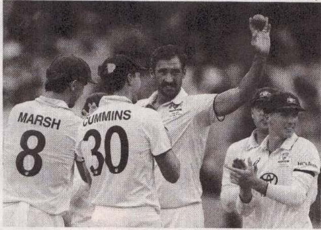
அடிலெய்ட், டிசெ. 07

அவுஸ்திரேலியாவுக்கு எதிரான இரண்டாவது டெஸ்ட் போட்டியில் இந்தியா தனது முதல் இன்னிங்ஸில் 180 ஓட்டங்களுக்கு சகல விக்கெட்டுகளையும் இழந்தது. இந்தியா - அவுஸ்திரேலியா இடையிலான பார்டர் - சுவாஸ்கர் கிண்ணத் தொடரின் 2ஆவது டெஸ்ட் போட்டி அடிலெய்ட் மைதானத்தில் நேற்றுத் தொடங்கியது. பகலிரவு போட்டியாக நடைபெறும் இந்த ஆட்டத்துக்கான நாணயச்சுழற்சியில் வென்ற இந்திய அணியின் தலைவர் ரோஹித் சர்மா முதலில் துடுப்பாட்டத்தை தெரிவு செய்தார்.