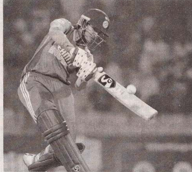
மும்பை, டிசெ. 17

மேற்கு இந்திய தீவுகள் அணிக்கு எதிரான முதல் ரி - 20 போட்டியில் 49 ஓட்டங்கள் வித்தியாசத்தில் இந்திய அணி வெற்றி பெற்றது.