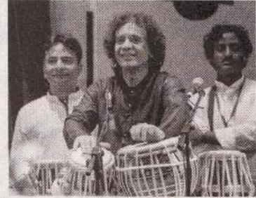
காவில் வசித்து வந்தார்.

இந்தியாவை சேர்ந்த பிரபல தபேலா இசைக்கலைஞர் ஜாகிர் உசேன். மும்பையைச் சேர்ந்த இவர் பல்வேறு திரைப்படங்களில் தபேலா இசை அமைத்துள்ளார். மேலும், இசைக்கச்சேரிகளிலும் பங்கேற்று பிரபலமடைந்தார்.