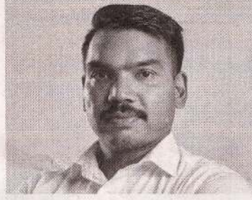
யையே ஜனாதிபதி அனுரகுமார திலாநாயக்க தொடர்ந்து அமுல்படுத்துகிறார்.

கடன் மறுசீரமைப்பு விவகாரத்தில் அரசாங்கம் இரட்டை நிலைப்பாட்டில் இருந்து கொண்டு செயற்படுகிறது. மக்களுக்கு ஒன்றை குறிப்பிட்டு விட்டு, இரகசியமான முறையில் பிறிதொன்றை செயற்படுத்துகிறது. ஆகவே கடன் மறுசீரமைப்பு விவகாரத்தில் உண்மையான நிலைப் பாட்டை அரசாங்கம் பகிரங் கப்படுத்த வேண்டும்-என்றார். (அ)