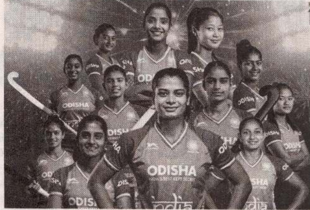
மஸ்கட், டிசெ. 17

மகளிர் ஜூனியர் ஆசிய கிண்ண ஹொக்கி போட்டியில் இந்திய அணி சம்பியனானது.