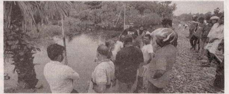
முடியாது தேங்கி நிற்கும் இடங்களை பார்வையிட்ட அதிகாரிகள், மக்களுடன் கலந்துரையாடியதுடன் இனிவரும்

யாழ்ப்பாணம், டி.செ.21 யாழ். கொடிகாமம் நாவலடி பகுதியில் வெள்ளம் வடிந்தோடாது தேங்கி நிற்கும் பிரதேசத்தை புகையிரத திணைக்கள் அதிகாரிகள் பார்வையிட்டனர். வெள்ளம் தேங்கி நிற்பதால் தாங்கள் எதிர்கொள்ளும் பிரச்சனைகள் குறித்து அப்பகுதி மக்கள் முறைப்பாடு செய்திருந்தனர். அத்தோடு, வெள்ளத்தை வெளியேற்ற நடவடிக்கை எடுக்குமாறும் கோரிக்கை விடுத்திருந்தனர். இதனையடுத்தே வெள்ளம் வெளியேற