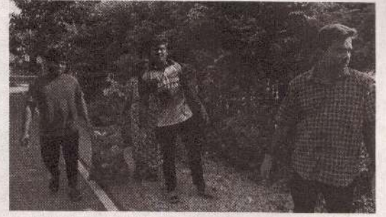
சமே' செயல்திட்ட உறுப்பினர்கள், நலன் விரும்பிகள் எனப் பலர் கலந்து கொண்டனர். (எ-05)

இதில் கிராம உத்தியோகத்தர்கள், பொதுச் சுகாதார பரிசோதகர், இளைஞர்கள், பிரதேச சபை உறுப்பினர்கள், 'விதையனைத்தும் விருட்சமே' செயல்திட்ட உறுப்பினர்கள், நலன் விரும்பிகள் எனப் பலர் கலந்து கொண்டனர். (எ-05)