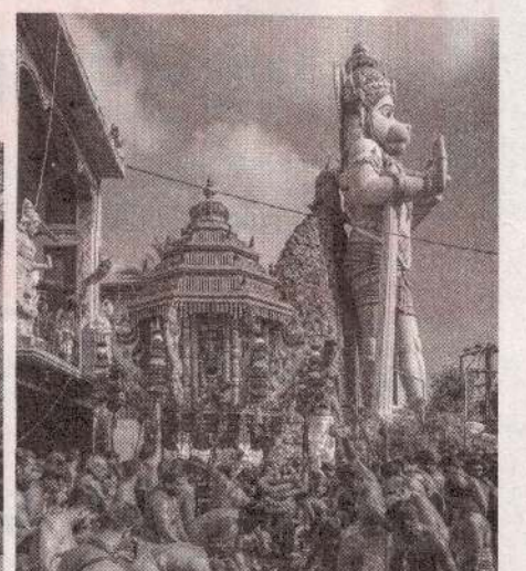
யாழ்ப்பாணம் - மருதனார்மடம் அருள்வளர் ஸ்ரீ சந்திர ஆஞ்சநேயர் ஆலய இரதோற்சவப் பெருவிழா நேற்றுக் காலை பக்திபூர்வமாக இடம்பெற்றது.