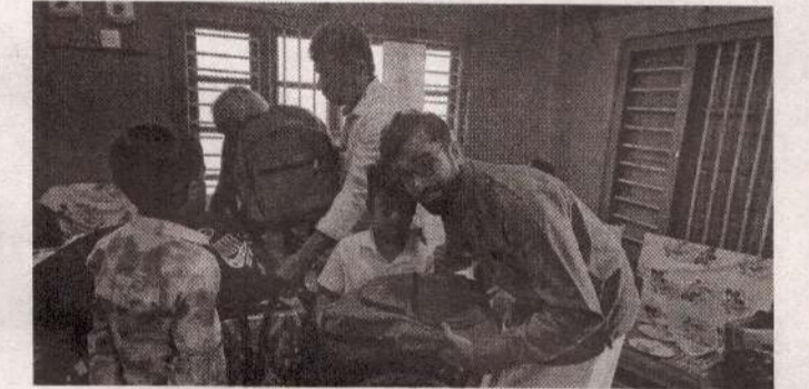
யாழ்ப்பாணம், டி.செ.30 சங்கானை பிரதேச செயலாளர் பிரிவில் தெரிவு செய்யப்பட்ட மாணவர்களுக்கு கற்றல் உபகரணங்கள் வழங்கும் நிகழ்வு சங்கானை பலநோக்கு கூட்டுறவுச் சங்க மண்டபத்தில் நடைபெற்றது.