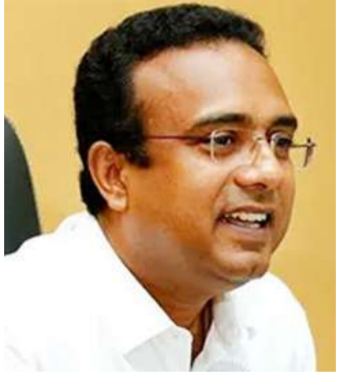
வாக்குகளை எதிர்பார்த்து எந்தொரு முடிவுகளும் எடுப்பது இல்லை இதுவரை எடுக்கப்பட்ட தீர்மானங்கள் யாவும் தேர்தலை குறிவைக்காமல் மக்களின் நன்மைக்காவும், எதிர்கால பொருளாதார நோக்கத்தை அடிப்படையாகக் கொண்டது எனவும் எதிர்வரும் ஜனாதிபதித் தேர்தலில் ஜனாதிபதி ரணில் விக்கிரமசிங்க அவர்களே போட்டியிடுவார் என தொழில் மற்றும் வெளிநாட்டு வேலைவாய்ப்பு அமைச்சர் கௌரவ மனுஷ நானாயக்கார தெரிவித்தார். காலி ஹபராதுவ பிரதேச

செயலகத்தில் நடைபெற்ற அபிவிருத்திக்குழுக் கூட்டத்தில் கலந்து கொண்ட அமைச்சர் ஊடகவியலாளர்களிடம் கருத்து தெரிவிக்கும் போதே இதனைக் குறிப்பிட்டுள்ளார். அமைச்சர் மேலும் கூறியதாவது: ஜனாதிபதி ரணில் விக்கிரமசிங்கவினால் பொருளாதாரத்தை நிலைநாட்ட முடியும். எனவே, பொருளாதாரத்தை முன்னேற்ற நினைக்கும் அனைவரும் அவருடன் இணைந்து கொள்வர். எதிர்காலத்தில் எப்படி போட்டியிடுவது என்பதை நாங்கள் தீர்மானிப்போம். எவ்வாறான ஏற்பாடுகள் இருந்தாலும் கௌரவ ரணில் விக்கிரமசிங்க அடுத்த ஜனாதிபதித் தேர்தலில் நிச்சயம் போட்டியிடுவார். தற்போதைய நிலையைப் போன்று ஒரு நிலை இருந்தாலும் நாங்கள் வாக்குகளுக்காக எந்தொரு நிவாரணங்களையும் வாங்கவில்லை. வாக்குகளை எதிர்பார்த்து இருந்தால் இவ்வாறு வரிகளை விதிக்க முடியாது. நாங்கள் இவ்வாறான முறைமையை மாற்றியமைக்கும் முயற்சியில் ஈடுபடுவதனால் சில வழக்கறிஞர்கள் எமக்கு எதிரே கோசம் எழுப்புகிறார்கள்.