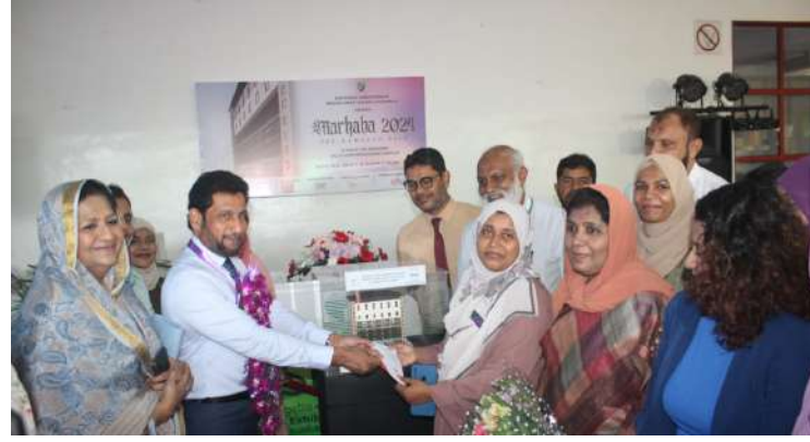
(அவ்வர்ப் ஏ சமூத்)

கொழும்பு முஸ்லிம் மகளிர் தேசிய கல்வூரி நேற்று (24) ஆம் திகதி பழைய மாணவிகள் இணைந்து பாடசாலையின் கட்டிட நிதிக்காக ரமழான் முன் விற்பனை சந்தை ஒன்றினை கொழும்பில் உள்ள இலங்கை கண்காட்சி மத்திய நிலையத்தில் நடாத்தினார்கள்..