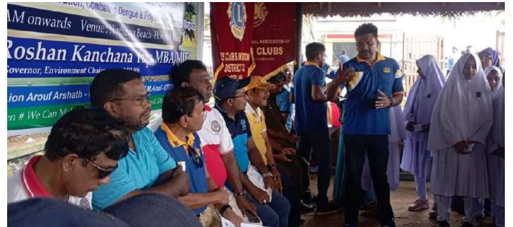
நிந்தவூர், சம்மாந்துறை மற்றும் கல்முனை நகர் லயன்ஸ் கழகம் ஒழுங்கு செய்திருந்த கடற்கரையோர சிரமதான நிகழ்வு நிந்தவூர் கடற்கரை பிரதேசத்தில் இடம்பெற்றது. இந்நிகழ்வில் விளையாட்டுக் கழகங்கள், பொது நலன்புரி அமைப்புகள், தன்னார்வு தொண்டர்கள், பாடசாலை மாணவர்கள் என பலரும் கலந்து கொண்டனர்.

தீயணைக்கும் படையினர் வரவழைக்கப்பட்டு தீயை அணைத்தும் வீடு தீக்கிரையாகிவிட்டது. அண்மையில் இக் கிராமம் வெள்ள அனர்த்தத்தினால் மிகவும் மோசமாக பாதிக்கப்பட்டிருந்தது. இச் சம்பவம் தொடர்பாக சாய்ந்தமருது பொலிஸார் மேலதிக விசாரணைகளை மேற்கொண்டு வருகின்றனர்.