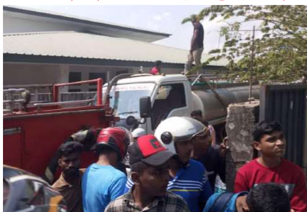
என்றும் தெரிவிக்கப்படுவதுடன், கல்முனை மாநகரசபை

(எம்.எம்.ஜெஸ்மின், எம்.ஜி.எம்.அஸ்ஹர்) கல்முனை மாநகர சபை எல்லைக்குட்பட்ட சாய்ந்தமருது பொலிவேரியன் குடியேற்ற கிராமத்திலுள்ள வீரோன்றில் சனிக்கிழமை (24) ஏற்பட்ட தீயினால் வீரோன்று முற்றாக எரிந்துள்ளதுடன் வீட்டிலிருந்த பொருட்களும் தீக்கிரையாகியுள்ளன. வீடு தீய்ப்பற்றிய நேரத்தில் வீட்டில் எவரும் இருக்கவில்லை என்றும் தீயை அணைக்க அயலவர்கள் மேற்கொண்ட முயற்சி வெற்றியளிக்கவில்லை