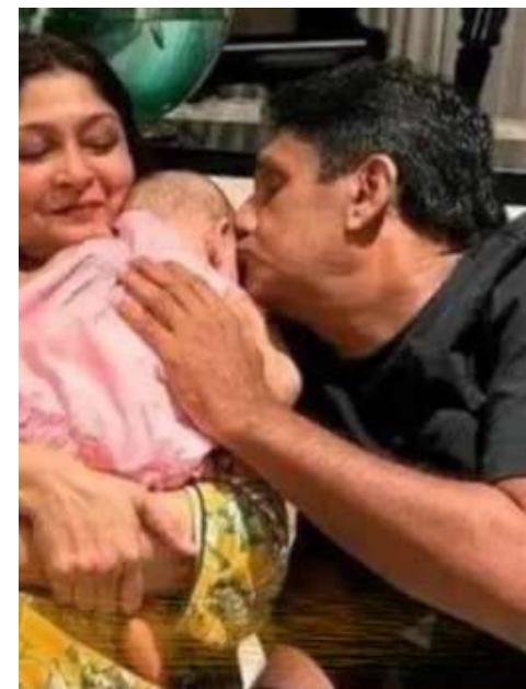
எதிர்க்கட்சித் தலைவர் சஜித் பிரேமதாசு தந்தையாகிய செய்தி நாடெங்கும் பரவலாக பேசப்படுகிறது. 02ம் பக்கம்பார்க்க...