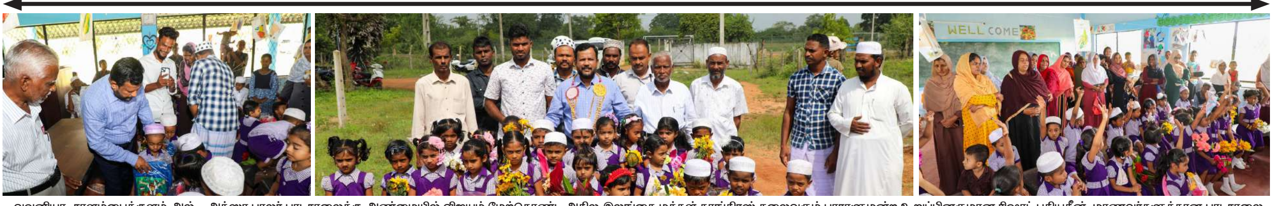
வவுனியா, சாளம்பெக்குளம் அல் - அக்ஸா பாவர் பாடசாலைக்கு அண்மையில் விஜயம் மேற்கொண்ட அகில இலங்கை மக்கள் காங்கிரஸ் தலைவரும் பாராளுமன்ற உறுப்பினருமான ரிஷாட் பதியூதீன், மாணவர்களுக்கான பாடசாலை உபகரணங்களை வழங்கி வைத்தார்.

இவ் விஞ்ஞான ஆய்வுகூடத்துக்காக உடல் உழைப்புக்கு மேலதிகமாக சுமார் 22 இலட்சத்துக்கும் அதிகமான செலவினை தம் அங்கத்தவர்கள் மூலம் நன்கொடையாகப் பெற்று பழைய மாணவியர்கள் மேற்கொண்டிருந்தமை குறிப்பிடத்தக்கது.