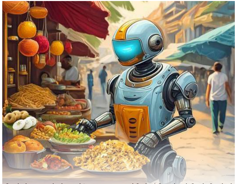
வழி காட்டல்களை பெற்றுக்கொண்டு பயணியங்கள்.

Driverless car> Robotaxi> Robotic car> Robo-car என்று அழைக்கப்படும் காரர்கள் இதில் முக்கிய இடத்தை வகிக்கிறது. "ரூஆயசவ உழஅந்" எனும் எண்ணக்கரு மூலம் ஒருவரது வீட்டில் இருக்கும் கதவுப் பூட்டுகள், கேரேஜ் கதவுகள், குளிரூட்டிகள், கமெராக்கள், ஷலிக்கள், குளிர்சாதனப்பீட்டிகள், சமையலறை உபகரணங்கள் போன்ற பல்வேறுபட்ட IoT (Internet of Things) உபகரணங்களை இண்புநெட் தொடர்பு மூலம் உலகில் எந்த ஒரு மூலையில் இருந்து கொண்டும் உங்களது Smart Watch, Smart Phone அல்லது வயடிடநவ ஜப் பயன்படுத்தி இயக்கலாம், அவதானிக்கலாம். கட்டுப்படுத்தலாம். Amazon, Apple, Google ஆகிய நிறுவனங்களது "Smart Home