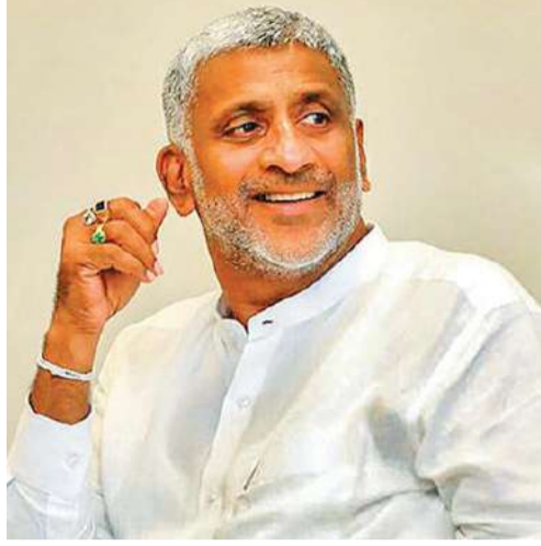
இதேவேளை, ஈஸ்டர் தினத்தன்று தாக்குதலுக்கு உள்ளான கட்டுவாப்பிட்டிய தேவாலயத்திற்கு அரசாங்கம் புதிய ஞாயிறு அறநெறிப் பாடசாலை கட்டிடத்தையும் 13 கோடி ரூபா செலவில் நிர்மாணித்து கொடுத்துள்ளமை குறிப்பிடத்தக்கது.