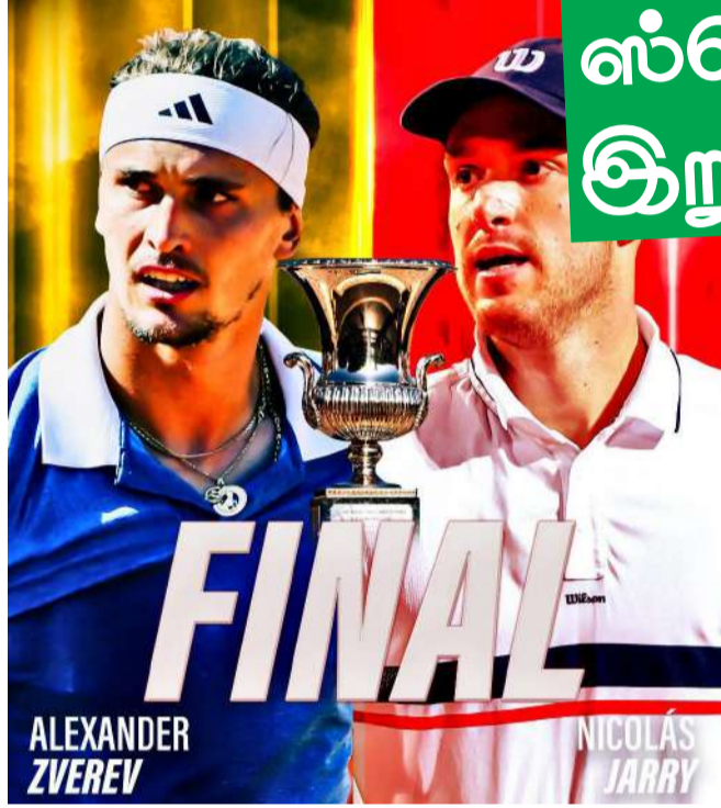
ஓபன் தொடர்களுக்கு அடுத்த

உலகப்புகழ் பெற்ற இத்தாலி ஓபன் டென்னிஸ் தொடரின் அரையிறுதிப் போட்டியில் சிலி நாட்டின் அலிஜான்ரோ டபிலோவை போராடி வீழ்த்திய ஜேர்மனியின் அலெக்ஸாண்டர் ஸ்வெரோவ் இறுதிப் போட்டிக்குத் தகுதி பெற்றார். உலக டென்னிஸ் தொடர்களில் விம்பிள்டன் மற்றும் அவுஸ்திரேலிய