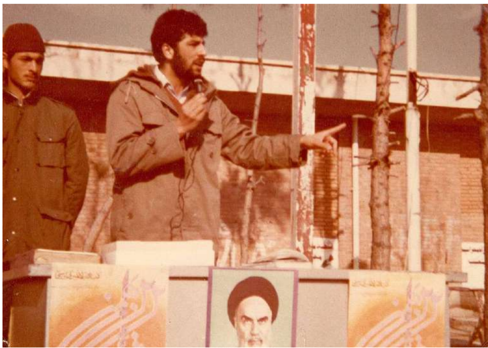
1979 இஸ்லாமிய புரட்சியின் போது இப்ராஹிம் ரைசிமின்

இலட்சக்கணக்கான ஈரானியர்கள் தெஹ்ராணில் ஒன்று திரண்டிருப்பதாகவும் சோகம் தாங்க முடியாமல் மக்கள் கதறியழுத வண்ணம் தமது தலைவருக்காக பிரார்த்தனைகள் புரிந்து வருவதாகவும் செய்திகள் தெரிவிக்கின்றன.