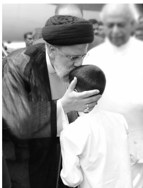
உமா லயா திறப்பு விழாவின் போது சிறுவனை முத்தமிடும் ஈரான் ஜனாதிபதி