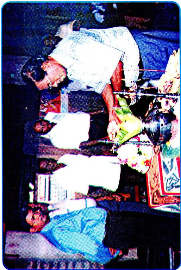
புத்தள்கேணி கணேச வித்தியாசாலையில் நடைபெற்ற விழாவொன்றின் பொழுது மங்கள் விளக்கேற்றி வைக்கின்றார்