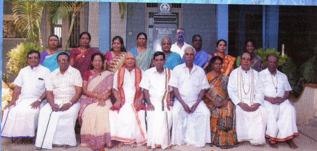
திருவாவருகறை ஆக்சன்ஸ் சேவசித்தாந்த நேர்முகப் பயிற்சி மையம் - கொழும்பு 2014-2015