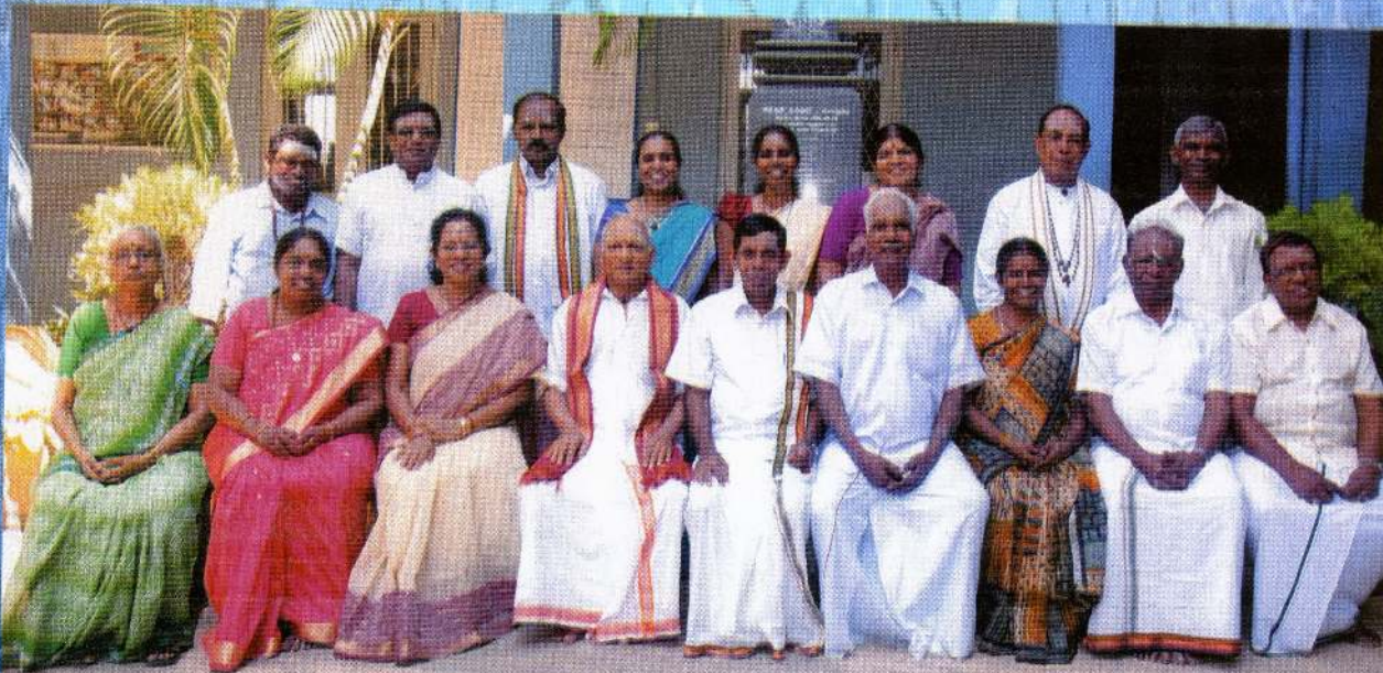
திருவாவருகறை ஆக்சன்ஸ் சேவசித்தாந்த நேர்முகப் பயிற்சி மையம் - கொழும்பு 2014-2015