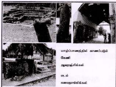
யாழ்ப்பாணத்தில் காணப்படும் கேணி ஆவரஞ்சிக்கல் மடம் கமைதாங்கிச்சிகல்

எல்லாளனுக்காக அமைக்கப்பட்ட ஈமச் சின்னத்தையும், அதற்காகப் பின்பற்றப்பட்ட ஈமக் கிரியைகளும் சங்க இலக்கியத்தில் வரும் கற்பதுக்கை என்ற நினைவுச் சின்னத்தை நினைவுபடுத்துவதாக உள்ளது. இவ்வாறு இறந்தவர்களுக்காக அமைக்கப்பட்ட ஈமச் சின்னங்களும், நினைவுச் சின்னங்களும் தமிழகத்திலும், ஈழத்திலும்