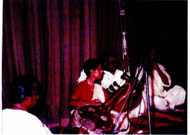
இனங்கை சட்டத்தரணிகள் சங்கமும், கொழும்பு சட்ட சமூகமும் இணைந்து Elphinstone அரங்கில் நடாத்தப்பட்ட நீதிரங்கா 97 கலைவிழாவின் போது.