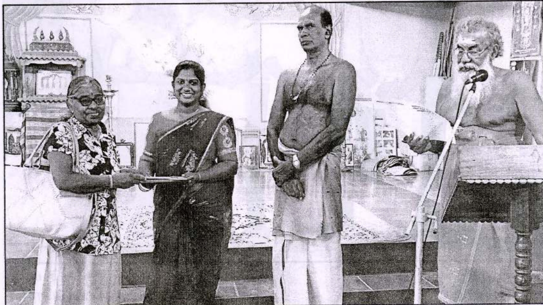
ஆடி மாத ஞானச்சுடர் மலர் வெளியீட்டில் சிறப்புப்பிரதி வழங்கப்படும்போது...