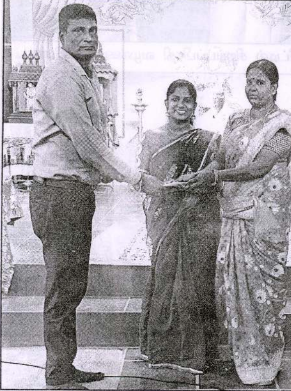
(மேலே) ஆடி மாத ஞானசீகடர் மலர் வெளியீட்டின்போது சிறப்புப்பிரதி பெற்ற அன்பர்கள்

சந்நிதியான் ஆச்சிரமத்தினால் மேற்கொள்ளப்பட்டுவரும் சமுதாயப் பணிகளின் வரிசையில் உடுப்பிட்டி அ.மி. பாடசாலையின் உதைபந்தாட்டம் மற்றும் கரப்பந்தாட்டம் அணியினருக்கான சீருடைகள், கரப்பந்தாட்டப் பந்துகள் கொள்வனவுக்காக 150,000. 00 ரூபா நிதி பாடசாலை சமூகத்தினரிடம் ஆடி மாத ஞானசீகடர் வெளியீட்டின்போது கையளிக்கப்பட்டது.