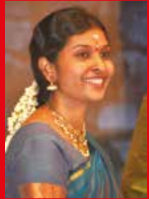
கலாக்ரீ தீவ்யா சுவேன் (இலங்கை)

என்ற னுள்ளங் கடலினைப் போலே எந்த நேரமும் நின்னடிக் கீழே எந்தன் உள்ளம் கடலைப் போல என்கிறார். மா கடலாகக் கிடந்தாலும் , எப்பேர்ப்பட்ட பெரியோரானாலும் பணிவு என்பது மிக அவசியம் என்பதை மறைமுகமாகக் கூட்டுகிறதோ இந்த வரிகள் என்று கூட