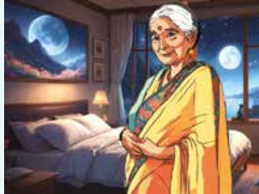
பாக்குப் பாட்டி (யேம்மீ)

அக்காலத்தில் தனிமை என்பதே யாருடைய வாழ்க்கையிலும் ஏற்பட்டதே கிடையாது. வயோதிபர் இல்லம் இருந்திருக்கலாம், ஆனால் கேள்விப்பட்டதே