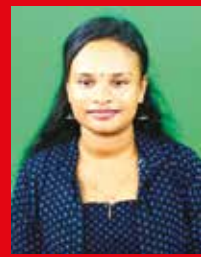
ஜீந்துஜா ஜியாலுமா ஜாழ்ப்பாணம்

உலகின் முதலாவது பெண் பிரதமரை அறிமுகம் செய்த எமது நாடு நிச்சயம் பெண்களின் எதிர்காலத்திற்கான முயற்சிகளை மேற்கொள்வதற்கு உறுதுணையாக இருக்கும் என்பது குறிப்பிடத்தக்க ஒரு விடயமாகும்.