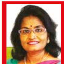
கொள் சீவலால் (யேர்மன்)

கொதிக்கும் வெயிலில் நாம் நடக்க வைப்பதைத் தானேற்று சூட்டிலிருந்து எம்மைப் பாதுகாக்கின்றது. பூச்சி புழுக்கள் எம்மைத் தீண்டாது தடுக்கின்றது. சேற்றிலே நாம் நடக்க சேற்றைத் தான் பூசி எமது பாதங்களைத் துப்பரவாக வைத்திருக்கின்றது. நோய் கிருமிகள் எம்மை வந்தடையா திருக்க பாதங்களைப் பாதுகாத்து உடலைப்