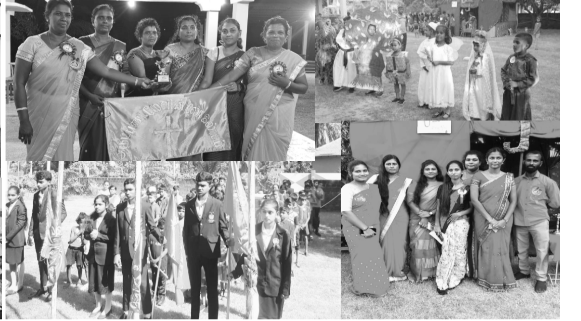
புனித திருமுழுக்கு யோவான் ஆலயம் - சாம்பல்தீவு