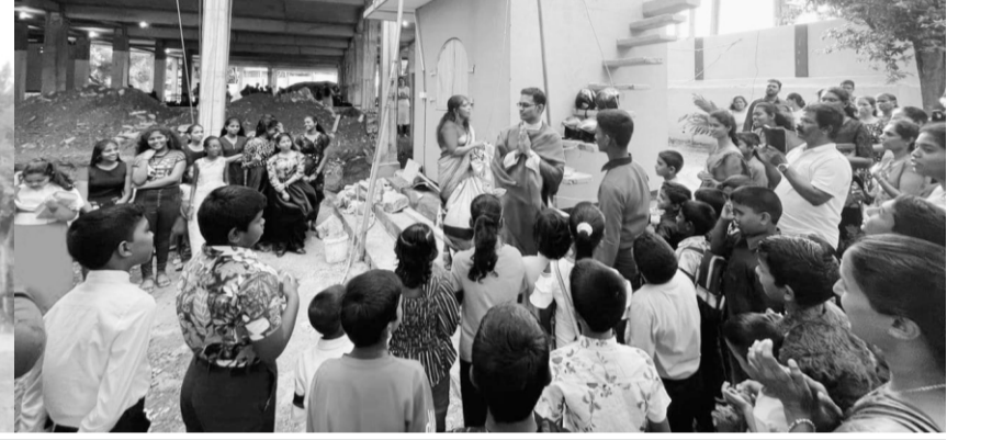
குழந்தை இயேசு ஆலயம் - உவ்ரமலை