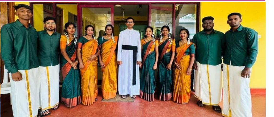
புனித லூர்து அன்னை திருத்தலம் - பாலையூற்று