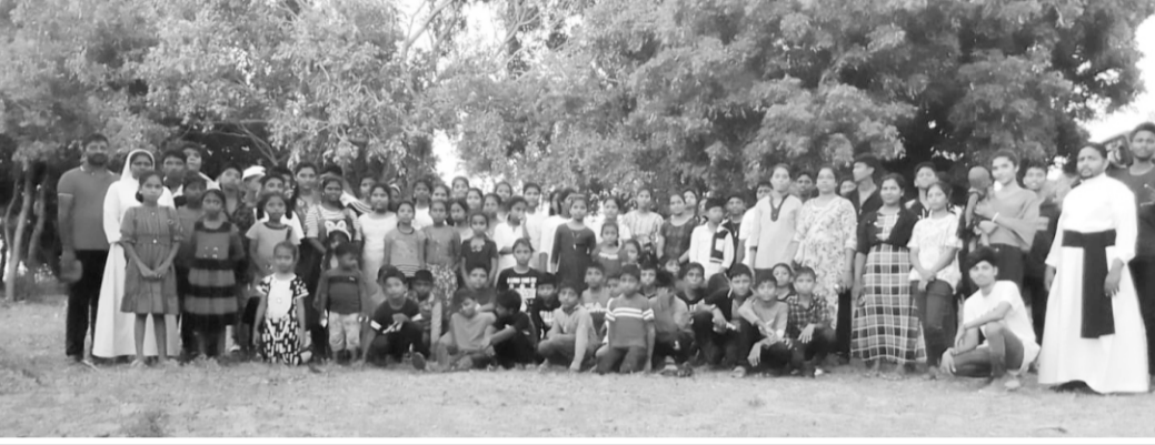
புனித சூசையப்பர் ஆலயம் - நல்லாவளி