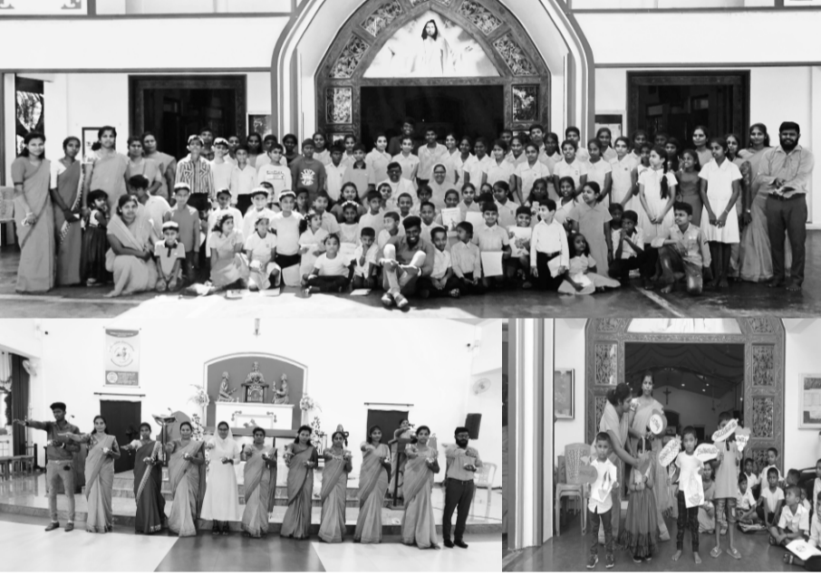
புனித சதா சகாய அன்னை ஆலயம் - அன்புவழிபுரம்