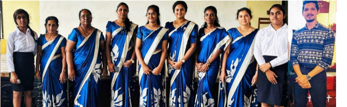
புனித ஆரோக்கிய அன்னை ஆலயம் - ஆண்டாங்குளம்