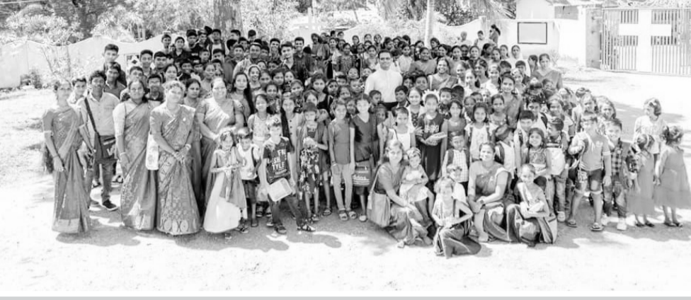
புனித லூர்து அன்னை திருத்தலம் - பாலையூற்று