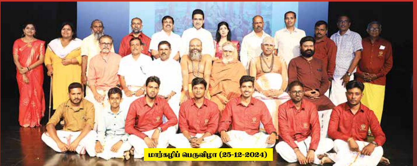
மார்கழிப் பெருவிழா (25-12-2024)