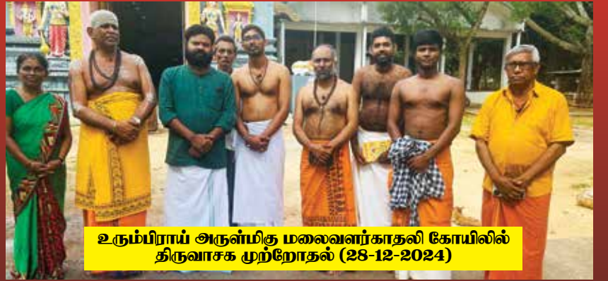
உருமிராய் அருள்மிகு மலைவளர்காதலி கோயிலில் திருவாசக முற்றோதல் (28-12-2024)