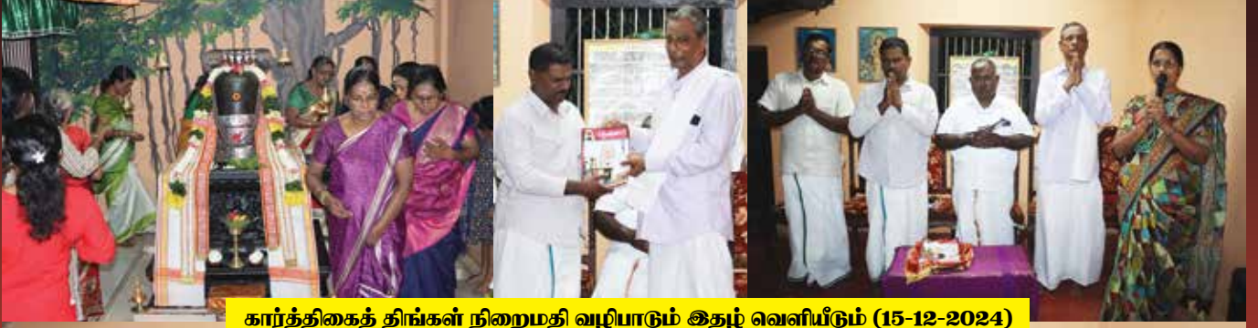
கார்த்திகைத் திங்கள் நிறைமதி வழிபாடும் இதழ் வெளியீடும் (15-12-2024)