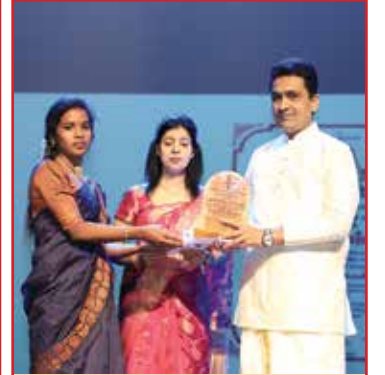
சிவ திருமதி. தேவசுதன் யதுசியா