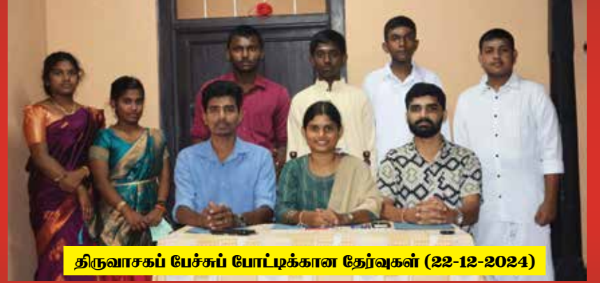
திருவாசகப் பேச்சுப் போட்டிக்கான தேர்வுகள் (22-12-2024)