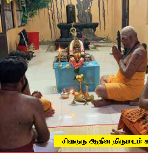
சிவகுரு ஆதீன திருமடம் கட்டியெழுப்ப வேண்டி தென்னாட்டில் வழிபாடுகள் (28-12-2024)