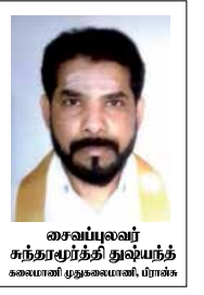
சைவப்புவர் சுந்தரமூர்த்தி துலையந் கலையாள் முதுகையாள், மீரக்க

வேலோடும் மலையில் நாகர் இருப்பிற்குப் பின்பு அங்கு வாழ்ந்த வேட மக்களால் கொத்துப் பந்தலிட்டுப் பூசிக்கப்பட்ட இடம் வேலோடும் மலையாக விளங்குகின்றது. மலை முகட்டின் நாகரின் இராசதானி இருப்பிடத்தின் சிதைவுகளின் மேல் வேல் கோயில் அமைந்துள்ளது. இங்கு வாய்கட்டிப் பூசை புரியும் பூசகர்களே வழிபாடுகளை முன்னின்று நிகழ்த்துகின்றனர். இக் கோயிலின் வடக்குப் பகுதியில் குமாரத்தன் கோயிலும் இடப்பக்கத்தில் இரும்பு வேல் ஒன்று நடப்பட்டு அதன் அருகாமையில் வற்றாத சிறு சணையும் அமைந்துள்ளது. இவ்விடம் சித்தர்களின் வசிப்பிடம் என்றும் பலர் கூறுகின்றனர். அவர்களின் கூற்றுக்கமைய இக்கோயிலின் பின்புறத்தில் பதினெண்சித்தர்களின் சிலைகளும் காணப்படுகின்றன. இவ் அடர்ந்த காட்டினுள் துறவிகளும் நடமாடுகின்றனர். அவர்கள் இத்தலத்திலேயே அண்டி வசிப்பதையும் காணக்கூடியதாக