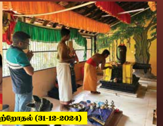
தென்னாடு ஜம்புகநாதர் திருக்கோயிலில் திருவாசக முற்றோதல் (31-12-2024)