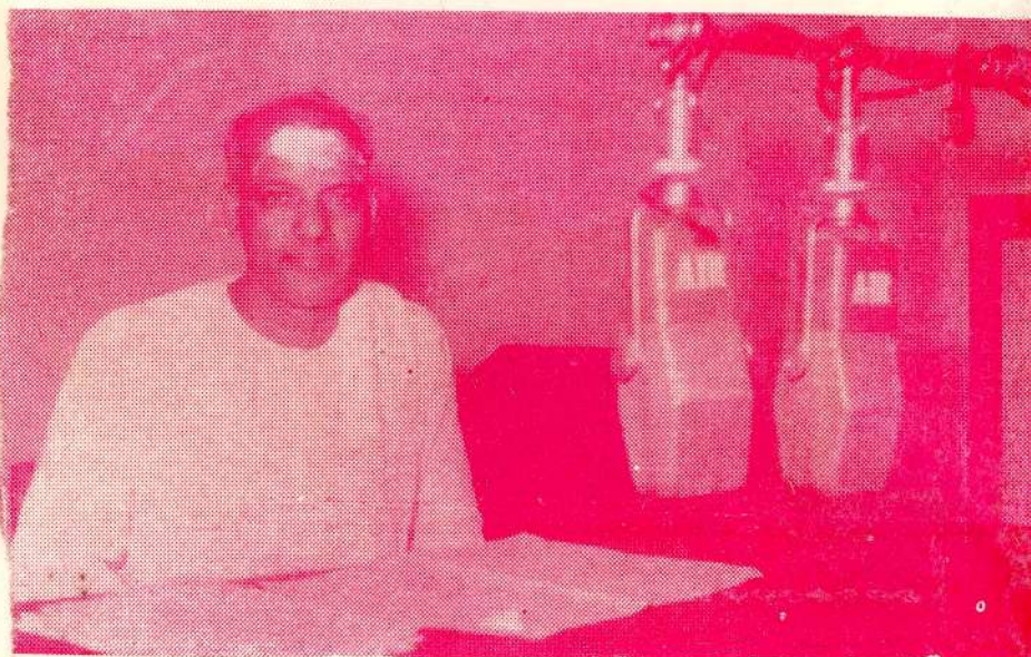
இத்திய வாடுலிபில் அக்மீக ஒலி - 1973