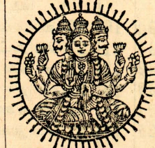
25 செவ்வாய் 31-04