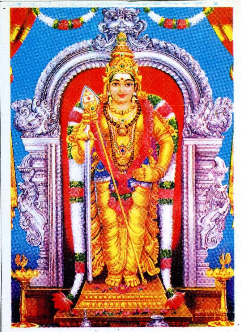
ிமரர் ஐயாத்துரை சக்திக்குமரன் அவர்களின் சிவபதப்பேறு குறித்த