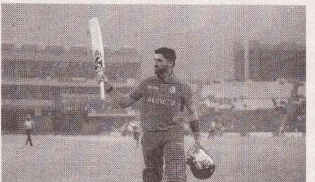
தில் அவுஸ்திரேலியாவுக்கு எதிரான லீக் ஆட்டத்தில் இங்கிலாந்து அணியின் பென் டக் கெட் 165 ஓட்டங்கள் குவித்ததே சாதனையாக இருந்தது. இதை முறியடித்து புதிய சாதனையை நிகழ்த்தியுள்ளார் இப்ராஹிம் ஸத்ராண்.

இந்த நிலையில், டில்லி அணியின் ஆலோசகராக இங்கிலாந்து அணியின் முன்னாள் வீரர் கெவின் பீற்றர்சன் நியமிக்கப்பட்டுள்ளார். அவர் அந்த அணியின் தலைமைப் பயிற்சியாளர் ஹேமங் பதானி, பந்து வீச்சுப் பயிற்சியாளர் முனாப் பட்டேல், ஆகியோருடன் இணைந்து பணியாற்றவுள்ளார். டில்லி அணி தனது முதல் ஆட்டத்தில் லக்னோ சுப்பர் ஜெயண்ட்ஸை எதிர்வரும் 24 ஆம் திகதி எதிர்கொள்கிறது.