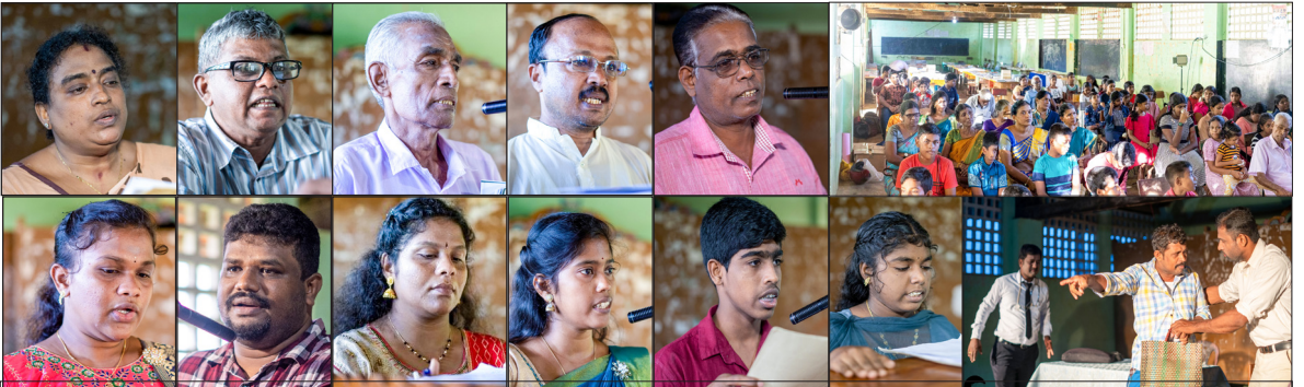
தேசிய கலை இலக்கியப் பேரவையின் புத்தக அரங்கவிழா-சுழிபுரம் 28,29,30.09.2023/ மாதகல் 25,26.11.2023