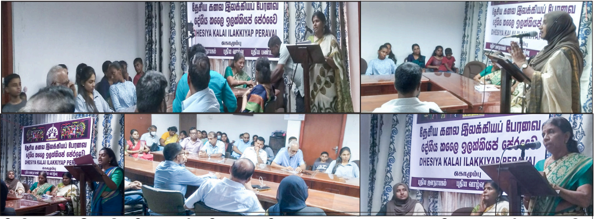
தேசிய கலை இலக்கியப் பேரவையின் கொழும்பு பேரவை ஏற்பாட்டில் 2024.03.31 கொழும்பு தமிழ்ச்சங்கத்தில் ஈழத்து இலக்கியங்களில் "பெண் உரிமை" தொடர்பான ஆய்வு, "கல்லாகவே ஆனாள்" நூல் வெளியீடு