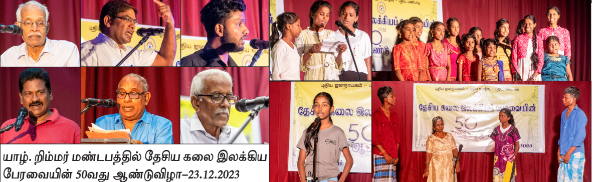
யாழ். றிம்மர் மண்டபத்தில் தேசிய கலை இலக்கியப் பேரவையின் 50வது ஆண்டுவிழா-23.12.2023