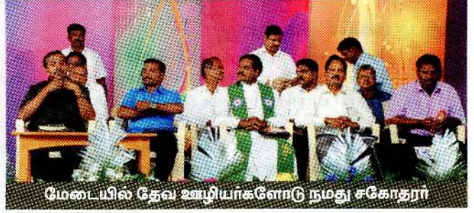
மேடையில் தேவ ஊழியர்களோடு நமது சகோதரர்