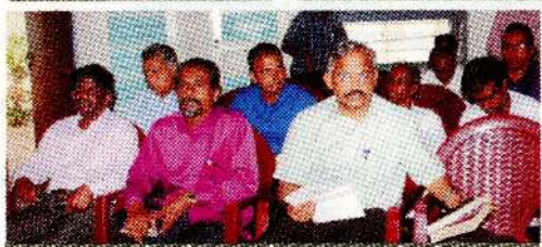
கலந்துக் கொண்ட போதகர்கள்