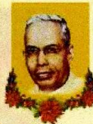
Dr. S. R. Ranganathan Father of Library Science in India