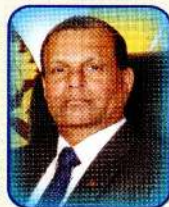
GA Chadrasiri Governor Northern Province

ලිපි සාකච්ඡා : 9/1, පිටි පාර, පානදුර, පානදුර.