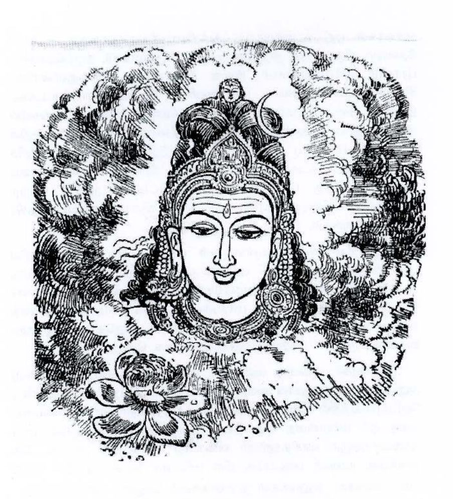
"எந்நாட்டவர்க்கும் இறைவா போற்றி"