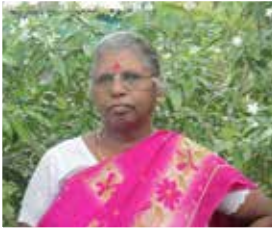
எழுத்தாளர் - தமிழ்க்கவி