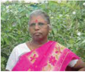
எழுத்தாளர் - தமிழ்க்கவி

'கெட்டாருக்குற்றார் கிளையிலுமில்லை வாழ்ந்தாருக்குற்றார் வழியிலுமுண்டு' மனிதர்களுடைய மனநிலையை சரியாக பகுத்துணரவைக்கும் பழமொழி அது.