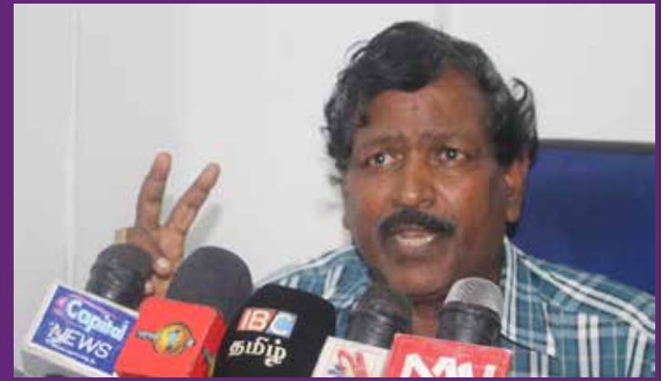
அவர்களிடம் கோரிக்கை விடுத்தார். நாடாளுமன்றில் நேற்று இடம்பெற்ற 2025 ஆம்