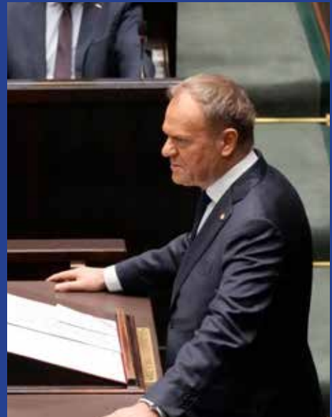
போலந்து நாட்டின் பிரதமர் டொனால்ட் டஸ்க் தெரிவித்துள்ளார்.

தற்போதுள்ள இரண்டு இலட்சம் வீரர்களை 5 இலட்சமாக அதிகரிப்பதற்காக கவே இத்தீர்மானம் எடுக்கப்பட்டுள்ளதாக