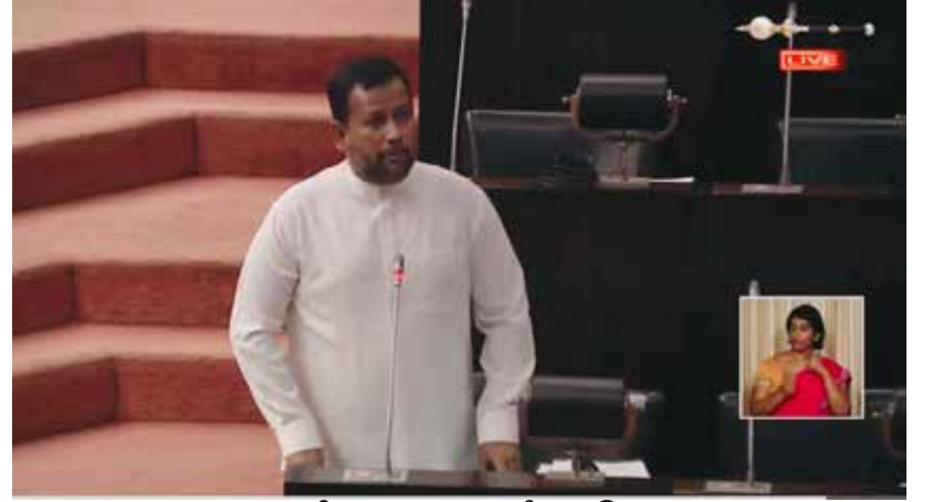
சுற்றறிக்கை மூலம் மீளப் பெறப்பட்டுள்ளது.

புத்தளம் நகரத்தில் உள்ள பாதைகள் நீண்டகாலமாக புனரமைக்கப்படாமல், சாதாரண ஓட்டோ ஒன்று கூட செல்ல முடியாத துர்பாக்கிய நிலை காணப்படுகின்றது. நான் கடந்த அரசாங்கத்துடன் பேசி, 150 மில்லியன் ரூபா ஒதுக்கப்பட்டது. புதிய அரசு வந்ததும் அந்த நிதி