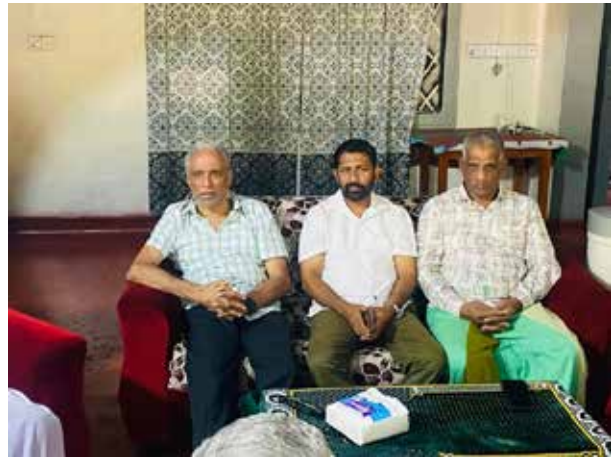
இக் கூட்டத்தில் மன்னார் மாவட்டத்தில் உள்நாட்சி மன்ற தேர்தலை முகம் கொடுப்பது