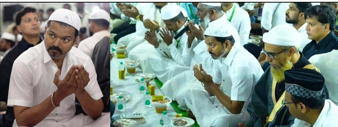
தளபதி விஜய் அரசியலில் கால் பதித்துள்ள நிலையில், நேற்று (07) தமிழக வெற்றிக் கழக கட்சி சார்பில் நடாத்தப்பட்ட இப்தார் நிகழ்ச்சியில், தலையில் தொப்பி அணிந்து பங்கேற்றார்.