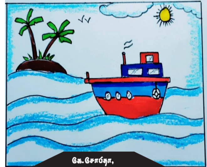
கே.சோபனா, ஆம் 05, அர்யாலை

முதலாம் பரிசு - 2000 இரண்டாம் பரிசு - 1500 மூன்றாம் பரிசு - 1000