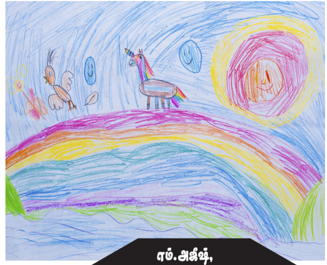
எம்.அஜீஷ், ஆம் 03 கிருகோஷமலை