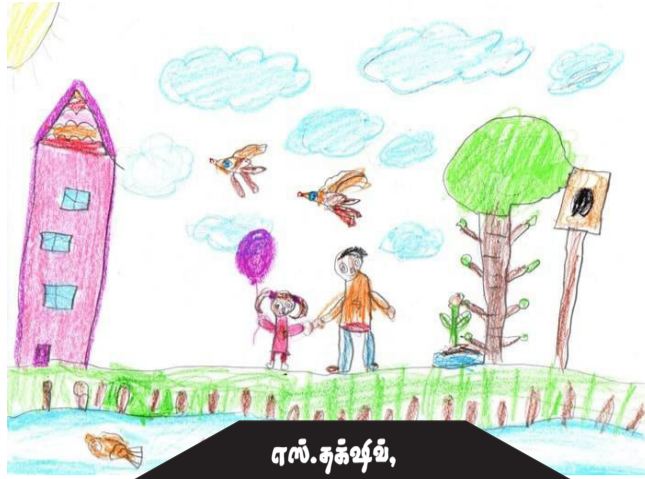
எஸ்.சுக்ஷித், ஆம் 03, கோப்பாய்