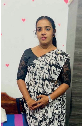
பரிசீலித்த பின்னர், சந்தேக நபர் விளக்கமறியலில் வைக்க மேலதிக நீதவான் உத்தரவிட்டார்.