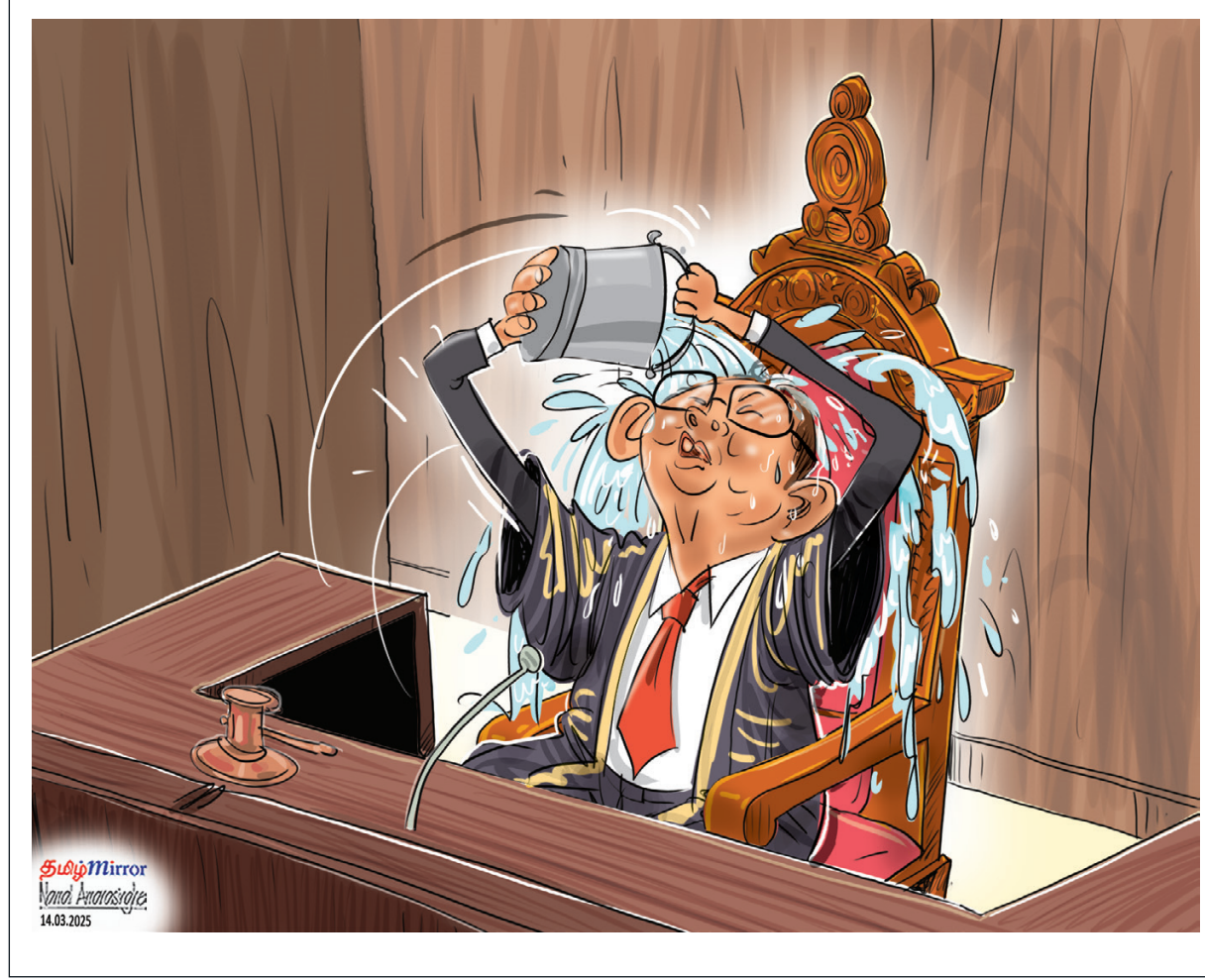
தமிழ்Mirror www.tamilmirror.lk 14.03.2025

Editorial: Tel: 011 2 479 372-8, Fax: 011 2 304 114 Marketing Manager (Dir.) 011 2 479 822, 077 3421 476 Circulation Manager (Dir.) 011 2 479 672, 077 3 219 775, Subscription Manager (Dir.) 011 2 479 626, 011 2 479 628, 077 3 502 183 E-mail: tamilmirror@wijeya.lk