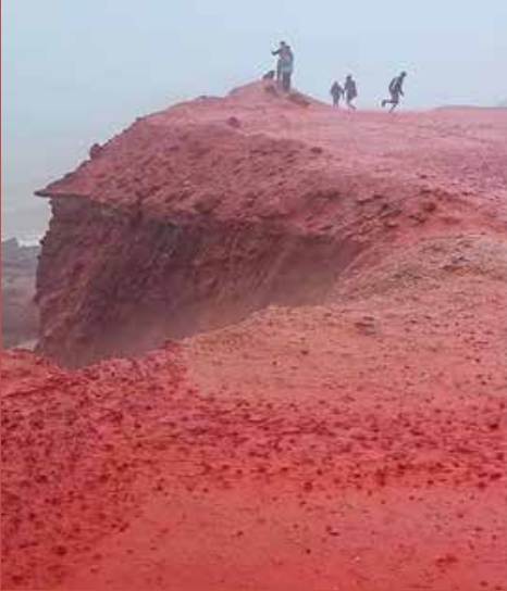
ஈரானின் ஹோர்மோஸ் தீவில் கடந்த சில நாட்களாக பெய்து வரும் கனமழை