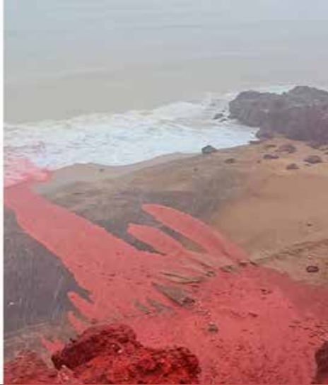
காரணமாக கடும் வெள்ளப்பெருக்கு ஏற்பட்டுள்ளதாக சர்வதேச ஊடகங்கள்