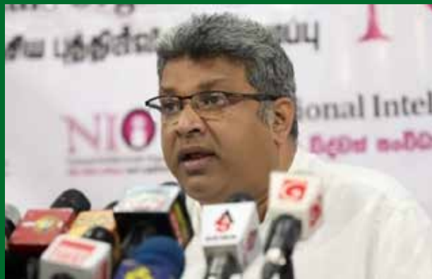
அமைச்சர் சட்டத்தரணி ஹர்ஷண

புதிய அரசமைப்பு உருவாக்கத் துக்கான பணிகளை புதிதாக ஆரம்பிக்க போவதில்லை. இடைநிறுத்தப்பட்ட இடத்தில் இருந்தே தொடங்குவோம். சிறந்த நிகழ்ச்சிநிரலுக்கு அமைவாகவே செயற்படுவோம். மக்களுக்கு வழங்கிய வாக்குறுதிக்கு அமைய புதிய அரசியலமைப்பினை நிச்சயம் உருவாக்குவோம் என்று நீதி மற்றும் தேசிய ஒருமைப்பாடு