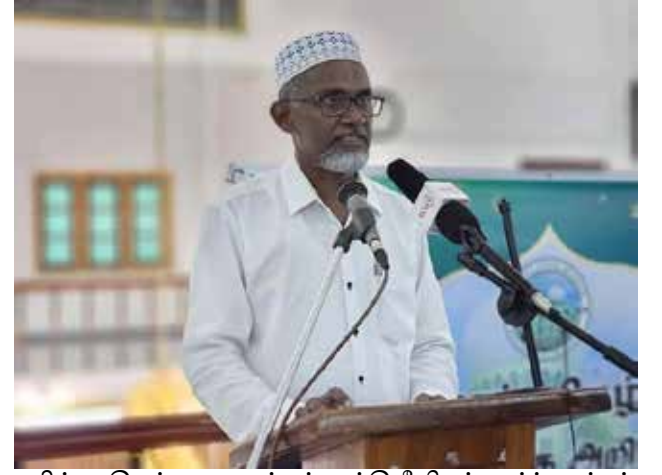
நிர்வாகிகள், உலமாக்கள், புத்திஜீவிகள், வர்த்தகர்கள், உட்கவியலாளர்கள் என பலரும் கலந்துகொண்டனர்.