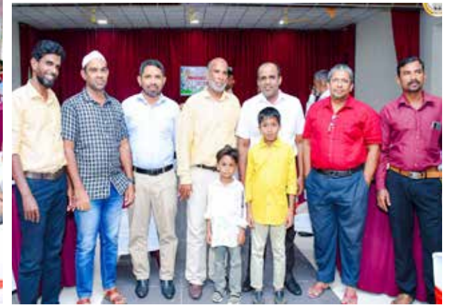
தலைவர்கள், உட்பட பொத்துவில் பிரதேச சபையின் செயலாளர், காணொலி பிரதேச சபையின் செயலாளர், உலமாக்கள், கல்வியியலாளர்கள்,