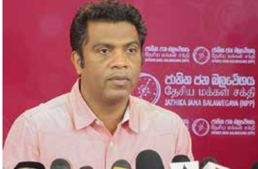
விடயங்கள் நியாயமானவையாகும். எந்தவொரு

போராயர்மெல்கும்குந்தினார்ஞ்சித்ஆண்டகையின் அறிவிப்பினை எதிர்மறையான ஒரு விடயமாக நாம் பார்க்கவில்லை. அவரால் தெரிவிக்கப்படும்