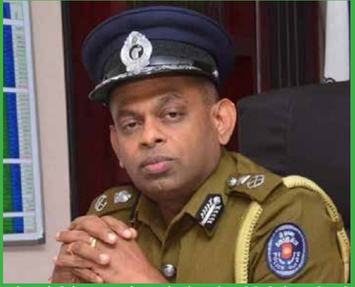
சம்பவத்தில் கொழும்பு குற்றத்தடுப்பு பிரிவின் அதிகாரி யொருவர் உயிரிழந்தார். இதன் காரணமாகவே தேசபந்து தென்னகோன் விளக்கமறியலில் வைக்கப்பட்டார்.

2023 ஆம் ஆண்டு டிசம்பர் 31 ஆம் திகதி வெலிகமையில் உள்ள ஹோட்டலுக்கு அருகில் இடம்பெற்ற துப்பாக்கி சூட்டு