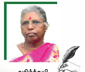
தமிழ்க்கவி சாகித்திய எழுத்தாளர்

“கன்னல் சொரியும் செந்நெல் விளையும் காலமென்றறிவாயடி. சின்னப்பிழைப்பைப் போட்டு மானிடர் நாட்டில் சென்றிடலாமடி மண்ணில் நமது கண்ணுக்கினிய மக்களைத்தூரந்தழையடி வன்னவயலில் செல்லயயிரில் நெல்லருந்திடலாமடி” விவசாயிகளின் அருமையான பாடல் காட்டும் திறமைகளை தொடர்ந்து ரசிப்போம் .