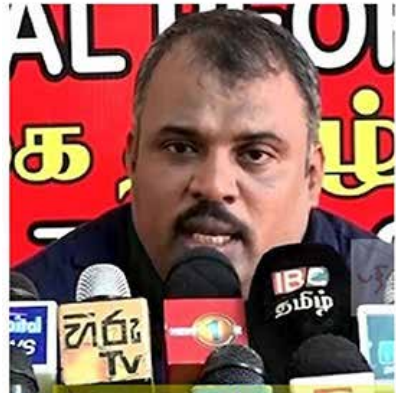
மக்கள் முன்னணி நேற்றுப் போராட்டம் நடத்தியது.