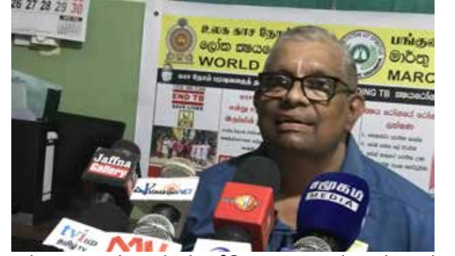
அப்படியானவர்களுக்குப் பரிசோதனையைச் செய்வதன் மூலம் அதனைக் கண்டறியலாம்.

எந்தவித அறிகுறியும் இல்லாமலும் இந்த நோய் உடலில் இருக்கலாம். குறிப்பாக ஏற்கனவே நோய் ஏற்பட்டவர்களுடன் தொடர்பில் இருந்தவர்கள் அல்லது நாட்டப்பட்ட நோய் கொண்டவர்கள், நோய் எதிர்ப்பு சக்தி குறைந்தவர்கள், சிறுநீரக நோயாளர்கள் போன்ற நோய்கள் உள்ளவர்களுக்கு அறிகுறிகள் வெளிப்படாமல் இந்த நோய்க் கிருமி தங்கக்கூடும்.