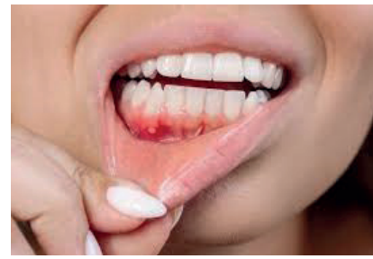
தொடர்பான பொருட்கள் மற்றும் வெற்றிலை ஆகியவை இந்த நோய்க்குப் பங்களிக்கும் புற்றுநோய் காரணிகள் என்பது