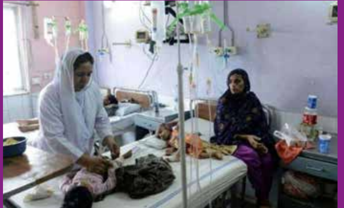
பாதிக்கப்பட்டுள்ளதாகவும் வெளிநாட்டு ஊடகங்கள் தெரிவிக்கின்றன.

இதேவேளை, கராச்சியில் கடந்த 2 மாதங்களில் மொத்தம் 550 குழந்தைகள் தட்டம்மை நோயினால்