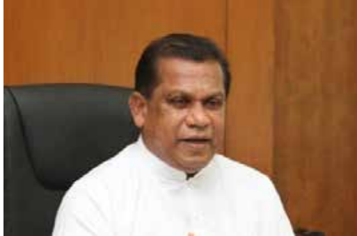
பங்கேற்று வருகின்றார். இந்த தேர்தல் எமக்கு

தற்போது மாவட்டத்துக்கு மாவட்டம் சென்று மக்கள் சந்திப்புகளை நடத்தி வருகின்றோம். எதிர்க்கட்சி தலைவர் சஜித் பிரேமதாசவும் அவற்றில்