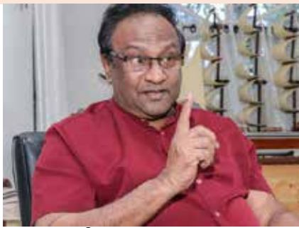
கருணா மீதும் பிரிட்டன் விதித்துள்ள தடை தொடர்பில் குறிப்பிடுகையில் அவர் இதனைத் தெரிவித்தார்.

இலங்கையின் பாதுகாப்பு துறையின் முன்னாள் உயர் அதிகாரிகள் மூவர் மீதும் விடுதலைப் புலிகளின் - முன்னாள் தளபதி