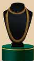
Bridal Set NEK 106 / 375 Harams