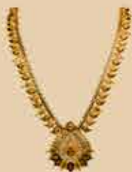
Haram NEK 318 Harams