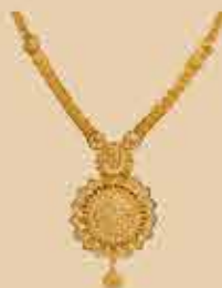
Haram NEK 473 Harams