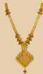
Haram NEK 477 Harams