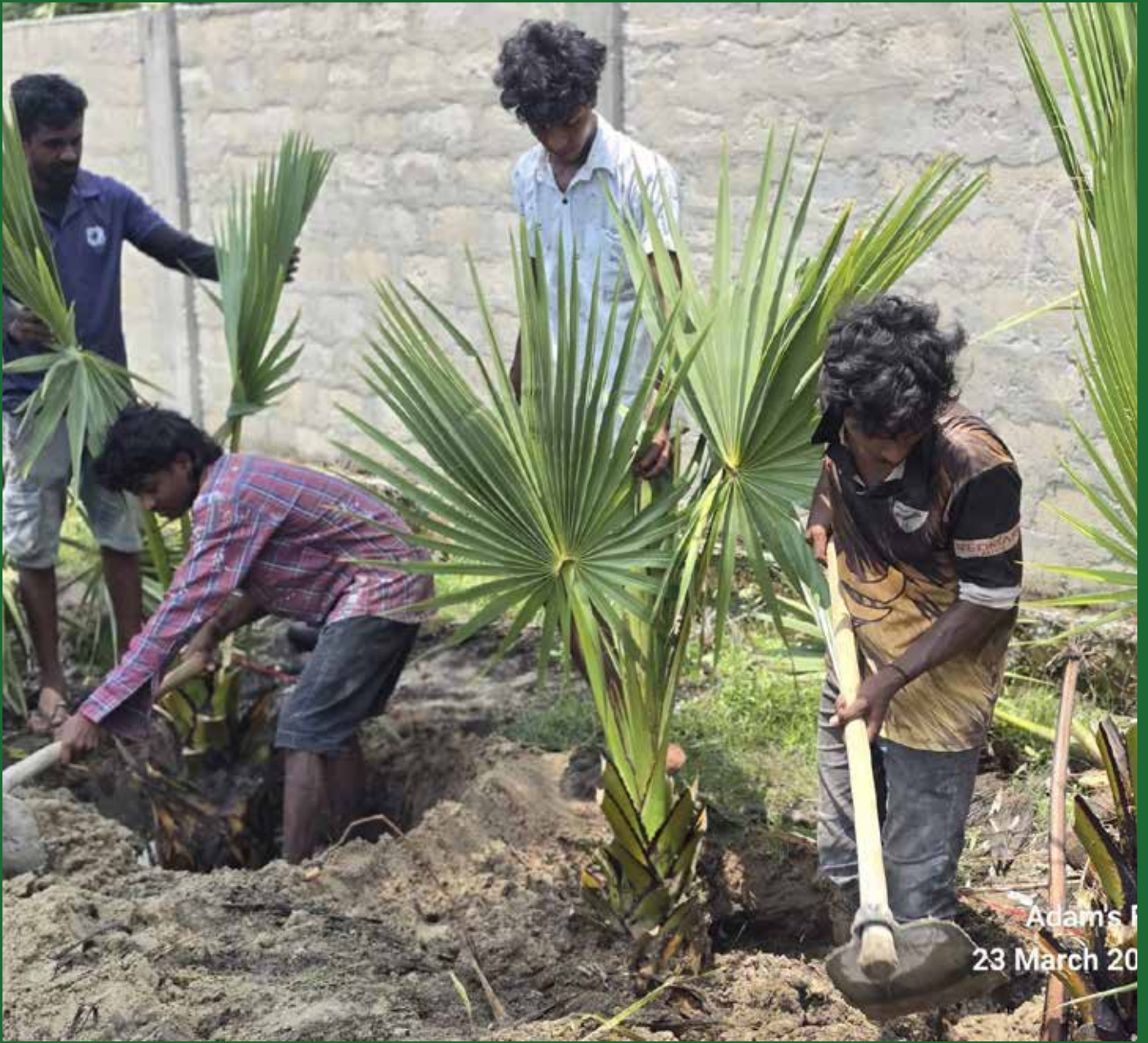
Adams I 23 March 20