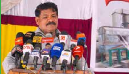
ஆணையிறவு உப்பளத்தில் உற்பத்தி செய்யப்படும் உப்பானது 06▶

மோடி - தமிழர் தரப்பு சந்திப்பு; இன்னமும் முடிவு இல்லையாம்