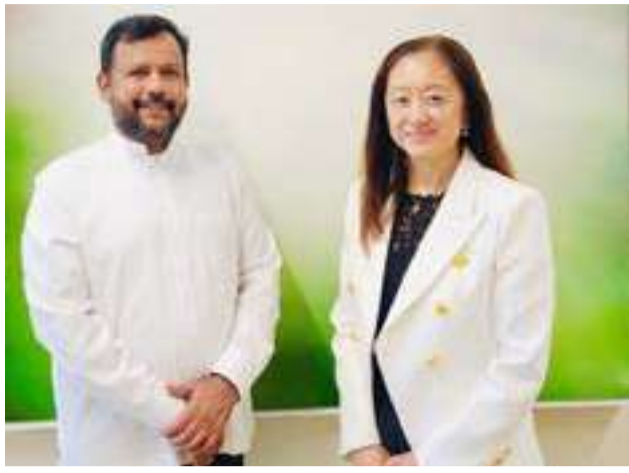
உலக அமைதிக்காகவும் அமெரிக்கா தனது ஆதரவினை வழங்க வேண்டும்” எனவும் அவர் வலியுறுத்தியுள்ளதாகவும் அவர் குறிப்பிட்டுள்ளார்.

கால தொடர்புகள் மற்றும் நிலைபேறான தன்மை குறித்து ஆக்கபூர்வமான கலந்துரையாடலொன்று இடம்பெற்றது. இதன்போது, புனித ரமலான் மாதத்தில், காசா மக்கள் எதிர்கொண்டுள்ள பெரும் துயரங்கள் மற்றும் உயிரிழப்புகள் தொடர்பிலும் எமது ஆழ்ந்த கவலையை தூதுவரிடம் வெளிப்படுத்தினோம். மேலும், மனிதாபிமான விடயங்களை முன்னிறுத்தியும்