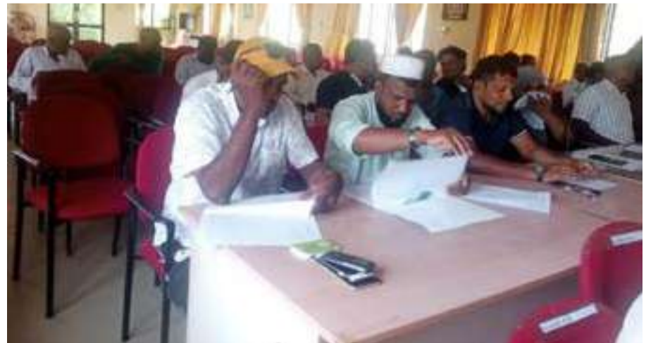
(எம். எச். எம். சியாஹ்)

கற்பிட்டி பிரதேச சபைத் தேர்தலில் போட்டியிடும் வேட்பாளர்களுக்கான செலவு அறிக்கையிடல் தொடர்பான தெளிவூட்டும் செயலமர்வு கற்பிட்டி பிரதேச செயலகத்தின் கேட்போர் கூடத்தில் (26) இடம்பெற்றது. புத்தளம் மாவட்ட தேர்தல் தெரிவத்தாட்சி அதிகாரிகள் காரியலயத்தின் ஏற்பாட்டில் இடம்பெற்ற இச்செயலமர்வில் உள்ளூராட்சி சபைத் தேர்தலில்