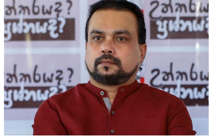
குறிப்பிடப்பட்டுள்ளது. ஆகவே ஆட்சியாளர்கள் அதற்கமைய செயற்பட வேண்டும் எனவும் அவர் குறிப்பிட்டுள்ளார். (ஊ)

எதிர்ப்பு போராட்டத்தில் ஈடுபட்டுள்ளார்கள். இதனைத் தொடர்ந்து அங்கு பாதுகாப்புக்காக அமர்த்தப்பட்டிருந்த இராணுவத்தினர் அவ்விடத்தில் இருந்து வெளியேறினார்கள். இதற்கான கட்டளையை இராணுவத் தளபதி பிறப்பித்துள்ளார். இந்த முறையற்ற செயற்பாட்டுக்கு அதிருப்தி வெளிப்படுத்தி மல்வத்து பீடம் ஜனாதிபதிக்கு கடிதம் அனுப்பி வைத்துள்ளது. பிற மதத்தை சார்ந்த இராணுவத் தளபதி இவ்விடத்தில் பொறுப்புடன் செயற்பட வேண்டும் என்று வலியுறுத்தப்பட்டுள்ளது. வடக்கு மற்றும் கிழக்கு மாகாணங்களில் உள்ள தொல்பொருள் இடங்களை பெளத்தம் மற்றும் இந்து என்று மத அடிப்படையில் அடையாளப்படுத்த வேண்டாம் என்று தொல்பொருள் திணைக்களத்துக்கு அரசாங்கம் அறிவித்துள்ளது. பெளத்த மதத்தை பாதுகாக்க வேண்டியது அத்தியாவசியம் என்று அரசியலமைப்பில் தெளிவாக