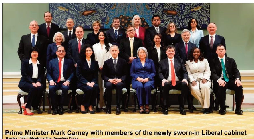
Prime Minister Mark Carney with members of the newly sworn-in Liberal cabinet

சஸ்கச்சுவான் மாகாணத்தின் வடக்கில் இருக்கும் Desnethe-Missinippi-Churhcill River தொகுதியில் மார்க் காணீ 100% வாக்குகளைப் பெற்றிருந்தார். மார்க் காணீ குவிபெக் மாகாணத்தில் உள்ள Pierrefonds-Dollard