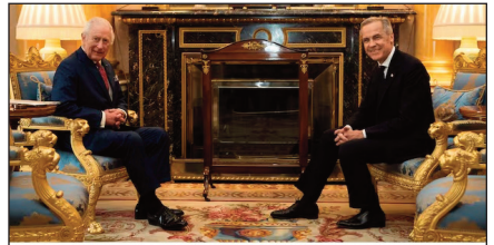
Mark Carney meets with King Charles

திட்டம் இல்லை எனக் கூறிய மார்க் காணி பிரதமராகப் பதவியேற்றதைத் தொடர்ந்து பிரித்தானியா மற்றும் பிரான்ஸ்