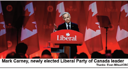
Mark Carney, newly elected Liberal Party of Canada leader

படிக்கும் காலத்தில் Ice Hockey விளையாட்டு வீரராக இருந்தார்.