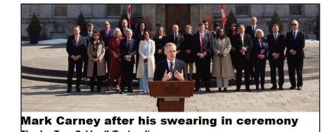
Mark Carney after his swearing in ceremony

இருக்கின்றனர். மார்க் காணியின் அமைச்சரவையில் மூவர் புதியவர்கள். ஏனையோர் முன்னர் அமைச்சர்களாகப் பதவி வகித்தவர்கள்.