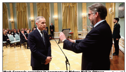
Mark Carney's swearing-in ceremony at Rideau Hall in Ottawa

திட்டம் இல்லை எனக் கூறிய மார்க் காணி பிரதமராகப் பதவியேற்றதைத் தொடர்ந்து பிரித்தானியா மற்றும் பிரான்ஸ்