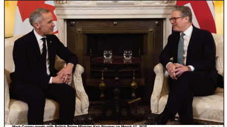
Mark Carney meets with British Prime Minister Keir Starmer on March 17, 2025

Keir Starmer, மன்னர் சார்ள்ஸ்ஐ பக்கிங்ஹாம் அரண்மனையிலும் மற்றும் பிரான்ஸ் நாட்டின் அதிபர் Emmanuel Macron ஆகியோரைச் சந்தித்தார்.