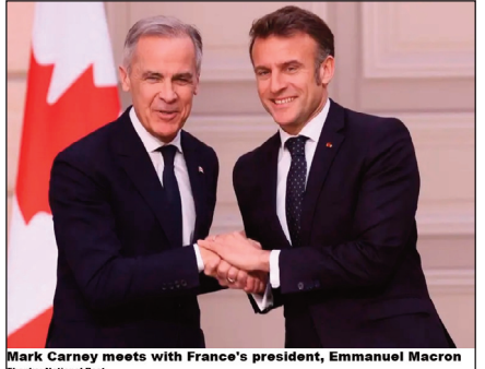
Mark Carney meets with France's president, Emmanuel Macron

நாடுகளுக்குப் பயணம் செய்தார். அந்தப் பயணங்களின்போது பிரித்தானியப் பிரதமர்